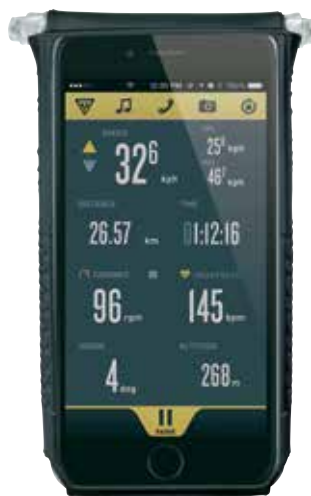
Działa z iPhone 6