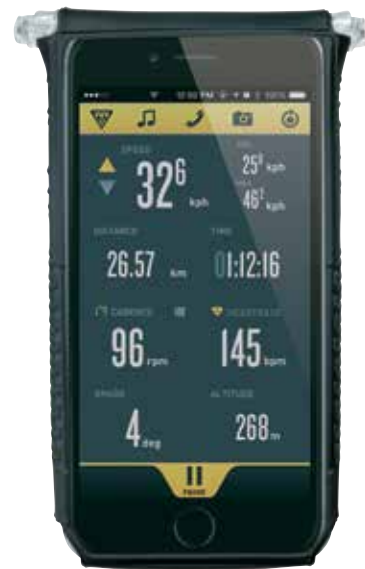
Działa z iPhone 6+